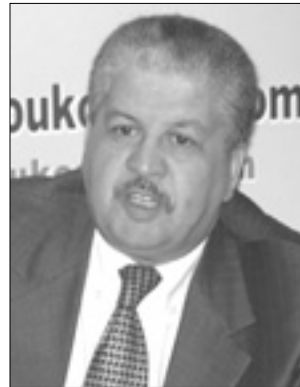
عبد المالك سلال

وأكد سلال أن الرئيس بوتفليقة "رجل فذ استطاع من خلال سياسة المصالحة الوطنية أن يقنع الجزائريين بفضائل التسامح والتعايش مع بعضهم البعض لبناء مستقبل أبنائهم، وهم في نفس الوقت فخرون بتاريخهم العريق". كما أوضح سلال الذي أكد ملي ملف الشقق بغرفة واحدة، أنه تم اتخاذ قرار لتنفيذ برنامج استثنائي لفائدة ولاية الشلف، للقضاء نهائيا على الشاليهات والسكنات الهشة وتمكين مواطني الولاية التي "ابتليت بالكوارث الطبيعية وعانى سكانها من مصائب متتالية". وقال سلال أن "لا خيار آخر للجزائر غير تطوير فلاحتها لذلك كان محورا هاما في مسعى الدولة نحو تنمية وتنويع الاقتصاد الوطني، لما لها من أثر إيجابي في تقليص الفاتورة الغذائية