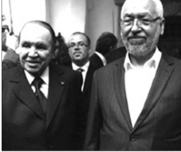
نصر الدين بن حديد - تونس

تولي وسائل الإعلام التونسية هذه الأيام أهمية كبرى لما يراه البعض دوراً جزائرياً في الوضع التونسي، سواء كانت "وساطة" أو هي "وصاية" تشمل حركة النهضة وحركة نداء تونس وتدفع بهما نحو تهميش الأحزاب الأخرى أو حتى "الاستحواذ" على الحكومة بالكامل، الإعلام التونسي، وإن راح حذراً التقيضين في قراءة الدور الجزائري وعلاقة هذا الجار بتونس، إلا أنه مجمع على اعتبار زيارة كل من راشد الغنوشي والبايجي قائد السبسي للجزائر في مرتين، دليلاً لا يقبل المناقشة على علاقة كلا الرجلين بالرئيس عبد العزيز بوتفليقة، وكذلك الأهمية التي يوليها العقل السياسي والأمني الجزائري للجار التونسي، وخصوصاً ما يجري فيه وبالآخرن الاحتمالات التي قد تؤول إليها الأوضاع في البلد الذي أشعل ما يسمى "الربيع العربي".