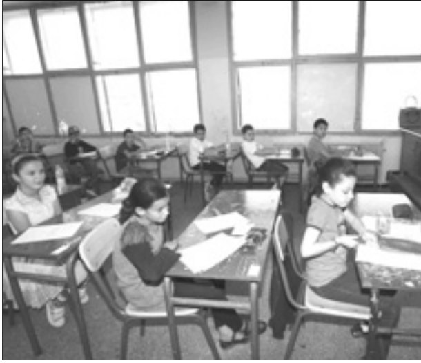
الوزارة قد تلغي الدورة الاستدراكية

وكشفت مصادر لـ"الشروق"، أنه منذ 2005 نسبة النجاح في الدورة الاستدراكية لامتحان شهادة نهاية المرحلة الابتدائية، لم تتعد 4 بالمائة، وأظهرت التقارير أن نسبة النجاح الوطنية قدرت 71 بالمائة في الدورة الأولى، في حين تم تسجيل نسبة نجاح في الدورة الاستدراكية قدرت بـ7,3 بالمائة، وأما في سنة 2007، بلغت نسبة النجاح في الدورة الأولى 86 بالمائة و6,92 بالمائة في الدورة الثانية، وفي سنة 2009 تم تسجيل نسبة نجاح قدرت بـ83,98 بالمائة في الدورة الأولى مقابل تسجيل نسبة نجاح قدرت بـ4,72 بالمائة في الدورة الثانية. في حين بينت نتائج الدورة الأولى قدرت بـ84,90 مقابل نسبة نجاح قدرت بـ7,51 بالمائة في الدورة الثانية.